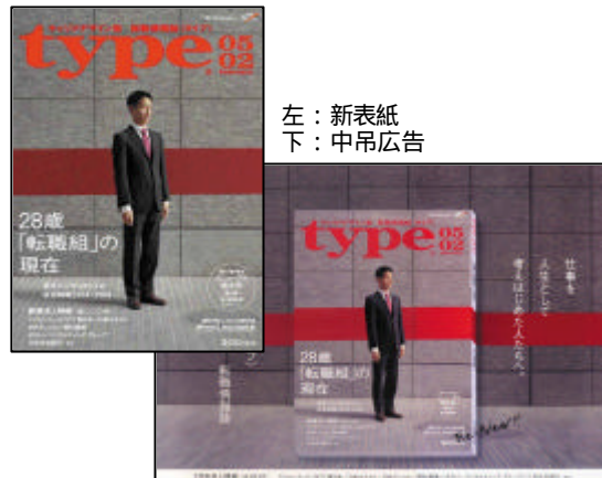
左：新表紙 下：中吊広告