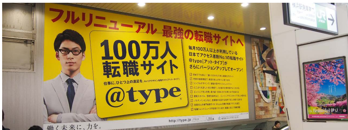
※写真：JR 横浜駅中央通路西口壁面

2月1日（日）より、JR 横浜駅にて大型の駅メディア（ポスター）を掲出いたしました。