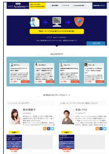
<type IT Academy Top 画面>

本サイトで提供する記事の執筆及び課題の出題については、IT・Web 業界を牽引するテクノロジストの方々を講師とし、より良質な技術情報の提供を目指して参ります。また、1つのコースに対して導入、応用、実践といった3段階で「技術が学べる記事」と「学んだ技術を試す課題」を用意しており、ステップアップしながら無料で新しい技術・スキルの習得が可能となっております。さらに、本サイトは、type ブランドサービスで初めて facebook やtwitter などの SNS アカウントを活用したソーシャルログイン機能を搭載しており、より多くのエンジニアユーザーが手軽にアカウントを開設できるような仕組みになっております。